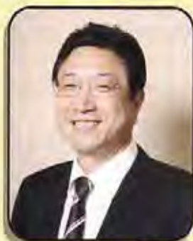
この技術の開発者

お近くの理容室・美容室で 気軽に悩みを打ち明けてください 私たちは親身な対応と増毛技術で お客様との心と心を結んでいきます